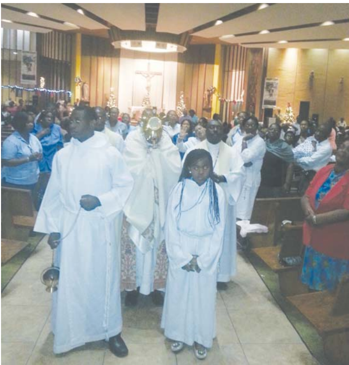
Les fidèles ont défilé en lente procession de la chapelle Holy Family Catholic Church (14500 NE 11th avenue), en empruntant la douzième Avenue jusqu'à la 151è Rue, vant de mettre le cap vers la chapelle via la 11è Avenue.

NORTH MIAMI - Cette année encore, plusieurs centaines de chrétiens haïtiens s'étaient donnés rendez-vous à Holy Family Catholic Church, North Miami, à l'occasion de sa tradi-