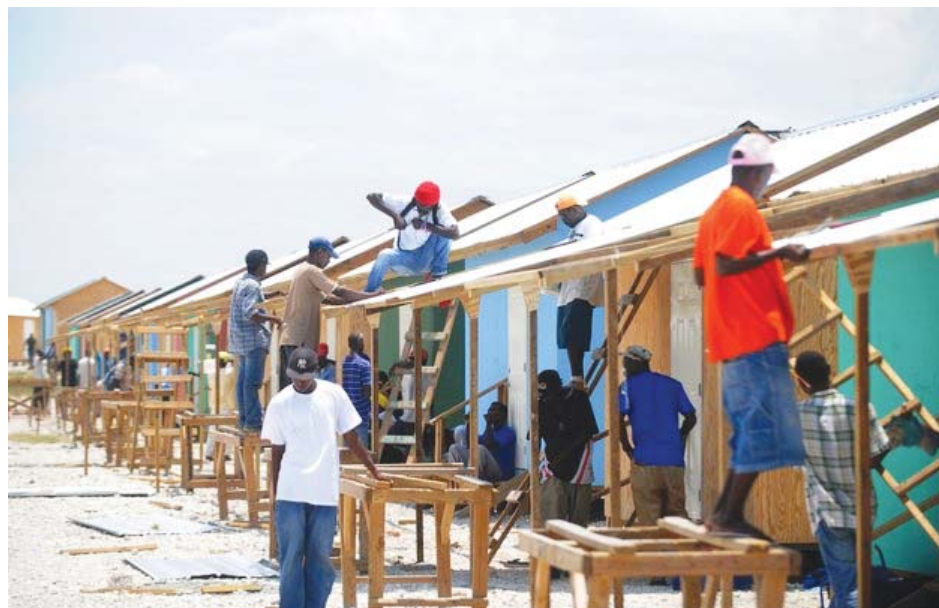
The UNDP has established community support centers to facilitate the reconstruction process, enabling some 30,000 families to take charge of repairing and rebuilding their homes to date.

Haiti's remarkable recovery, moreover, has been largely driven by Haitians themselves. Within neighbourhoods, community members have set priorities for rebuilding homes and infrastructure, ensuring