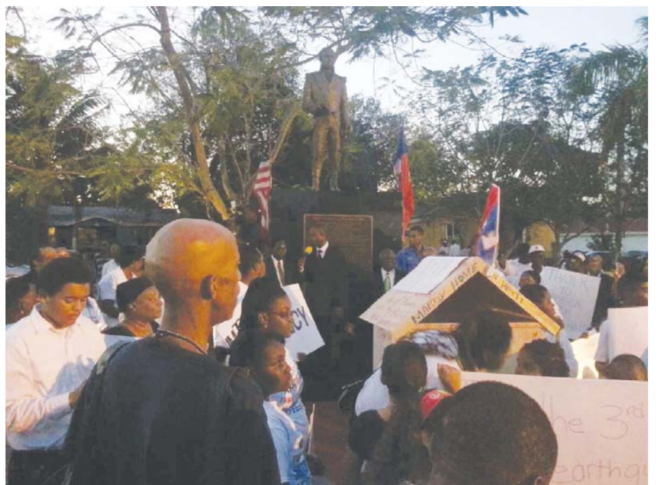
The group of less than 100 people gathered on North Miami Avenue and 54th Street and walked to their destination on 62nd Street.