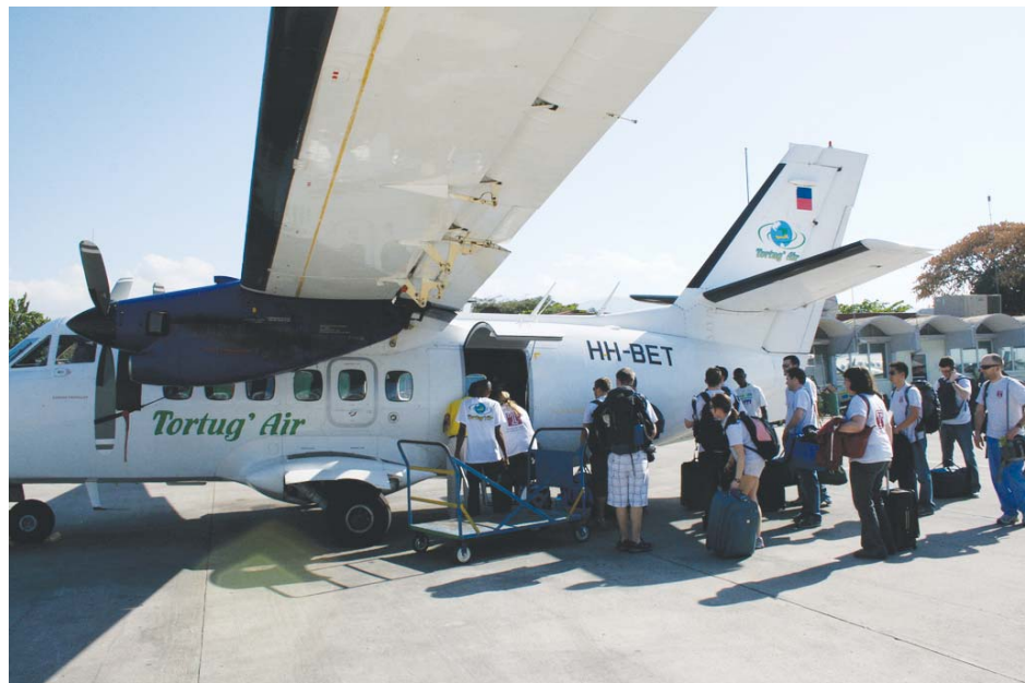
La compagnie Tortug' Air dessert actuellement un total de huit destinations, dont trois îles de la Caraïbe : République Dominicaine, les Bahamas et les Iles Turques-et-Caïques.

Dans leur réquisition, les responsables de Tortug' Air font valoir que les États-Unis feraient preuve de bonne volonté de son engagement à soutenir le développement économique en Haïti, s'ils venaient à approuver leur demande. Avec un total de 200 salariés dont la compagnie emploie actuellement, l'approba-