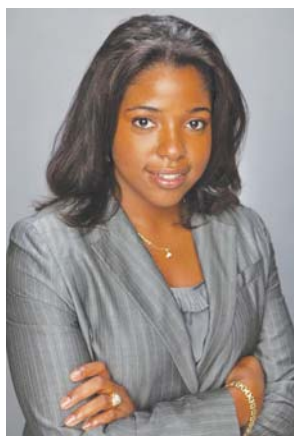
By Patricia Elizee, Esq

Starting in February, the Department of Homeland Security (DHS) will be charging a $165 Immigrant Fee to immigrants who have their lawful permanent resident application processed by a U.S. consulate or embassy abroad. U.S. Citizenship and Immigration Services (USCIS), the agency that processes most