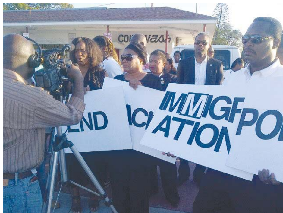
Still, family reunification is missing. The crowd chanted "Reunification." At this point, it was clear what the message was.

Although the amount of people attending the event was not huge, the message was very clear. Where is the money that was collected? Who has that money? When will the people get some help? Both the Haitian government and the American government owe the people an explanation. It is sad that the Haitians are still living under the tents, not due to lack of money or resources, but rather lack of care. It