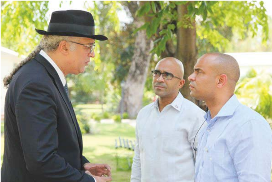
Singer and businessman Richard Auguste Morse (left) in conversation with Haiti's Prime Minister Laurent Lamothe (right), and an unidentified man. The outspoken musician, hotelier, adviser and cousin to President Michel Martelly, announced publicly his resignation from the Haitian government last december, via his twitter account. "I handed my resignation on December 26, 2012. I no longer work for the Haitian Government," he wrote.

It was interesting to read a recent statement from Haiti's current Prime Minister in reaction to the latest US State Department travel warning: "Haiti is one of the safest destinations; not just in the Caribbean but throughout the world".