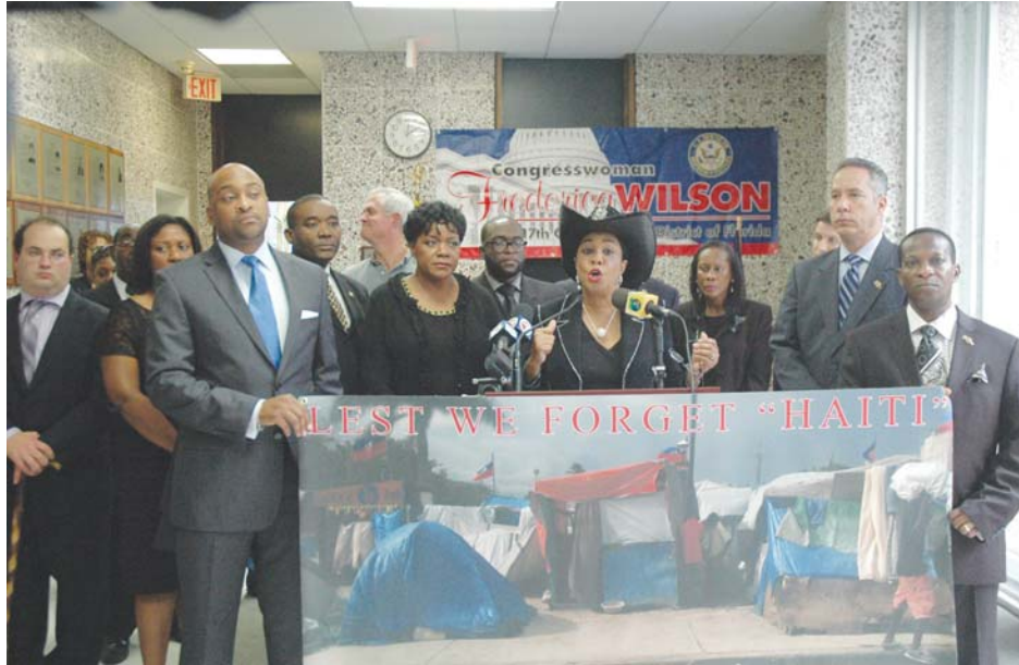
"We're dressed in black because we mourn what we know happened," said U.S. Congresswoman Frederica Wilson (center).

Most of the elected officials were dressed in black for the press conference held one day before the anniversary of the quake that killed more than 300,000 people Continued on P. 6