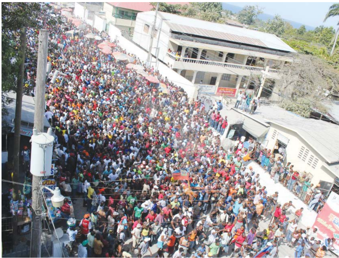
La procession "Kita Nago" sur la route de Carrefour dans l'après-midi du lundi 14 janvier 2013.