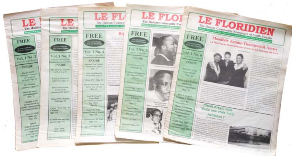
Cover pages of some "LE FLORIDIEN" back issues, Year 2001.

MIAMI -- Since January 2001, Le Floridien has been an important part of the day for the South Florida Haitian population's most sophisticated readers - readers who rely on this newspaper for the most comprehensive, engaging coverage of the news from arts, politics and entertainment to sports, business and science, in Haiti and the Haitian community. However, few readers know about its fascinating history - how it was started and sustained. With the paper reaching its 300th edition this month, readers deserve to know the story behind this publication.