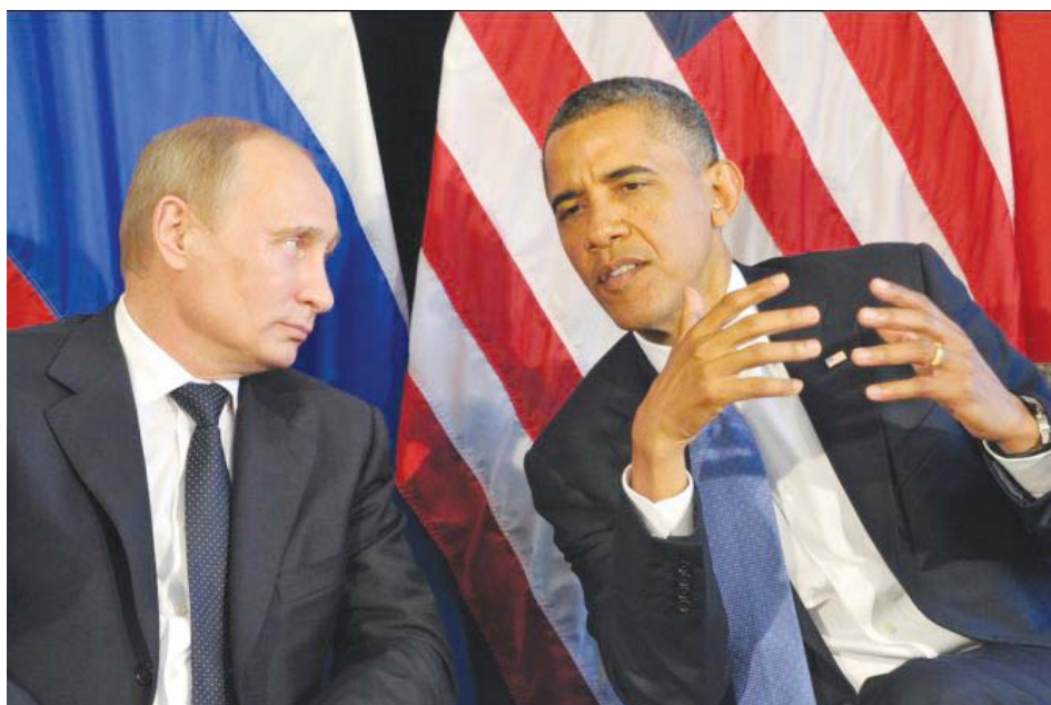
The President of Russia, Vladimir Vladimirovich Putin (l) and the President of United States, Barack Hussein Obama II.

"There are consequences should the Assad regime not comply with the framework agreed today. And if diplomacy fails, the United States remains prepared to act," Mr. Obama said in a statement shortly after the deal was unveiled.