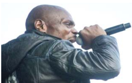
Le rappeur d'origine haïtienne Kery James

Une controverse dont les Jeux de la Francophonie se passeraient bien. Lors de la cérémonie d'ouverture, samedi soir à Nice (Alpes-Maritimes), le président du conseil général Eric Ciotti et le député-maire Christian Estrosi ont reproché au gouvernement de leur