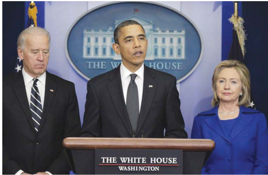
** FILE ** President Obama, accompanied by Vice President Joseph R. Biden (left) and Secretary of State Hillary Rodham Clinton, delivers a statement on Dec. 16, 2010, at the White House.

them, they'd say, 'It's way too premature to start talking about' the 2016 presidential race, Mr. Obama said.