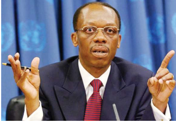
Former Haitian President Jean Bertrand Aristide

Jean Bertrand Aristide Marital Status Married to Mildred Trouillot