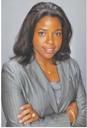
By Patricia Elizée, Esq

Business owners must be mindful of immigration considerations when hiring employees to work in their businesses. First off, it is illegal for any business owner to hire an individual who does not have work authorization in the United States. It is the business owner's burden to verify that the employee is able to legally work in the U.S.