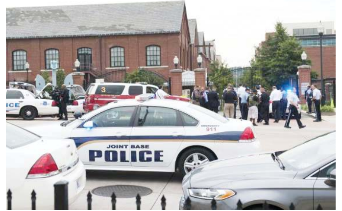
C'est aussi là qu'habite le chef d'état-major de la Navy, l'amiral Jonathan Greenert. Ce dernier a été évacué, ainsi que sa femme, vers le Pentagone.

Le quartier, en reconstruction et situé au bord de la rivière Anacostia dans le sud-est de la capitale fédérale, a été bouclé sur trois pâtés de maison. Plusieurs écoles ont été fermées. Des policiers et militaires étaient stationnés à chaque carrefour, selon la journaliste de l'AFP.