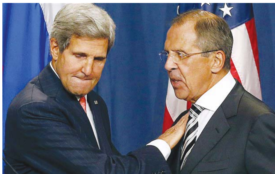
US Secretary of State John Kerry, left, and Sergei Lavrov, his Russian counterpart, after agreeing the proposal to eliminate Syria's chemical weapons

The first test will come within a week when Damascus is expected to provide a comprehensive list of its stocks, including names, types and