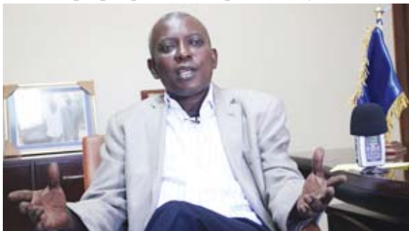
Le ministre de la défense Rodolphe Joazile

Cela s'explique par le manque de moyen au niveau