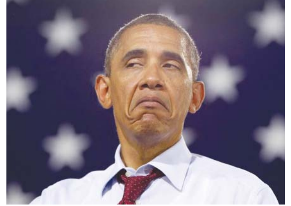
Barack Obama, 44th president of the United States.

Obama served three terms in the Illinois Senate, and is the first African