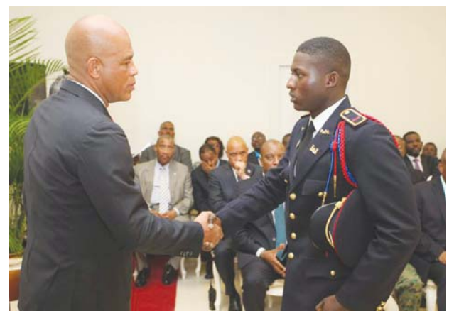
Un gradué saluant le Chef de l'Etat Michel Joseph Martelly

Le ministre n'a pas été en mesure de chiffrer globalement le coût de la formation de ces étudiants-militaires.