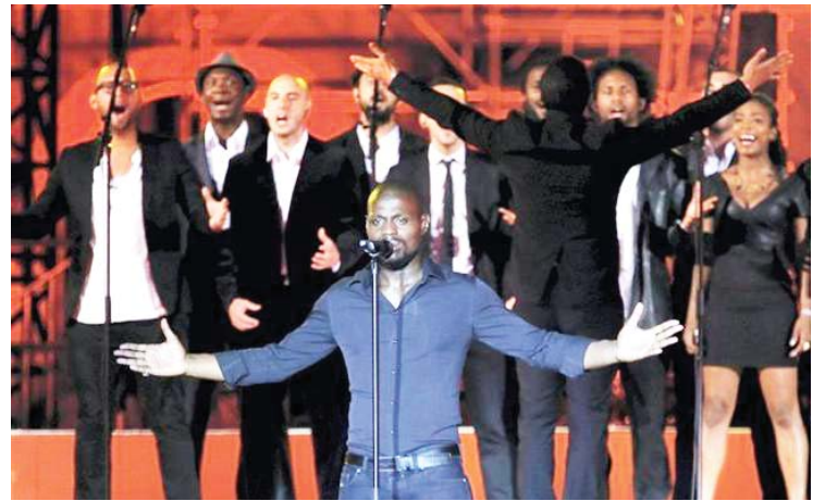
Le rappeur d'origine haïtienne Kery James à Nice en ouverture des Jeux de la Francophonie.

"La vie est un combat, pour ceux d'en haut comme pour ceux d'en bas. Si tu n'acceptes pas ça c'est que t'es qu'un lâche, lève toi et marche! [...] Pour ceux qui rêvent d'une France unifiée - parce qu'à ce jour y'a deux France, qui peut le nier ? - Et moi je serai de la 2ème France, celle de l'insécurité, des terroristes potentiels, des assistés... C'est ce qu'ils attendent de nous, mais j'ai d'autres pro-