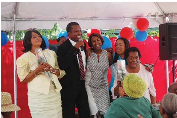
Membres du personnel de la clinique et invités chantant à l'unissons.