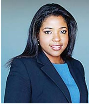
By Patricia Elizée, Esq

The Department of Homeland Security (DHS) has extended the re-registration deadline for Haitian nationals from May 2, 2014 to July 22, 2014. Approximately 51 thousand Haitian nationals are expected to file to extend their