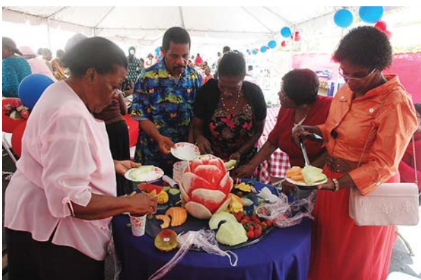
Musique, nourritures et boissons à volonté ont été offertes gratuitement entre 11hr du matin et 3hr de l'après-midi ce vendredi du weekend de la Fête des Mères.