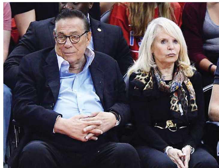
Donald Sterling and his wife Shelly.

REUTERS -- Donald Sterling, banned for life from the NBA for taped racist comments, has handed over control of the Los Angeles Clippers to his wife, according to media reports on Friday.