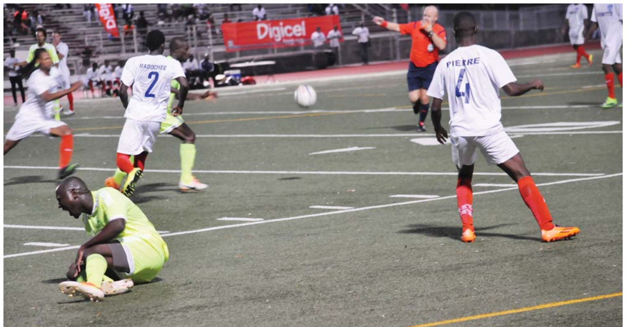
Une phase de jeu de la finale Saint-Marc vs Violette en première période.

Deux minutes plus tard, les violettistes eux-mêmes réagissaient par des attaques à outrance. Commençait alors une grosse période de domination des hommes de l'entraîneur Vanel Victor qui avec leur pressing habituel étouffaient pendant quelques bonnes minutes leur adversaire. Mais les saint-marcois ne se laissaient pas intimider. Ils se sont réveillés un peu vers la 76 e allant jusqu'à donner de la sueur froide aux violettistes en deux occasions. L'équipe aux couleurs traditionnelles jaune et vert reprennent une grosse domination territoriale mais se heurtent au mur des hommes en bleu et