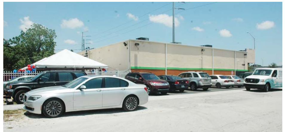
Vue extérieure du bâtiment de "Primary Medical Care center" au 11500 NW 7th Avenue, à Miami, lors de la journée de célébration de son premier anniversaire.