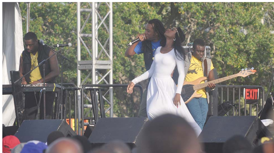
Zenglen a une nouvelle fois prouvé qu'il est un groupe toujours capable de performer sans complexe sur les grandes scènes.

Kassav ayant connu de petites difficultés techniques, a débuté sa prestation de façon très timide avec deux pièces presque inconnues du public présent, avant d'enchaîner avec des chansons plus rythmées pour réussir à faire danser la foule des fêtards. Les musiciens de ce