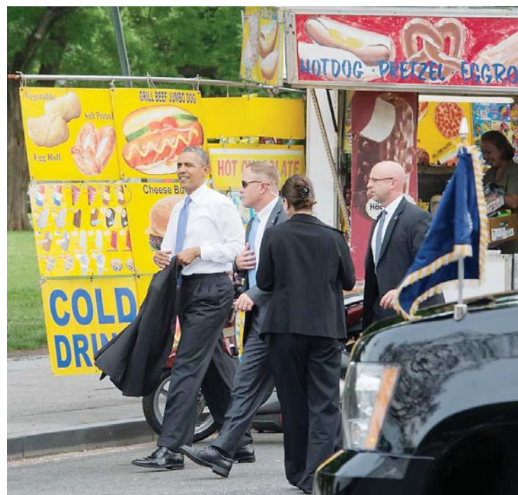
President Obama even stopped by a hot dog stand during his walk.

introduced themselves to the leader of the free world. They were joined by Anna, who asked the president, "Are you real?" This is also a question that everyone asks after watching any YouTube video (thanks, Jimmy Kimmel).