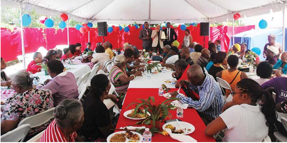
Vue partielle de la belle assistance qui a pris part à la célébration du premier anniversaire de PMCC.