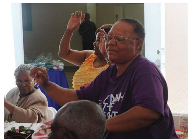
Patientes dansant au rythme de la musique compas