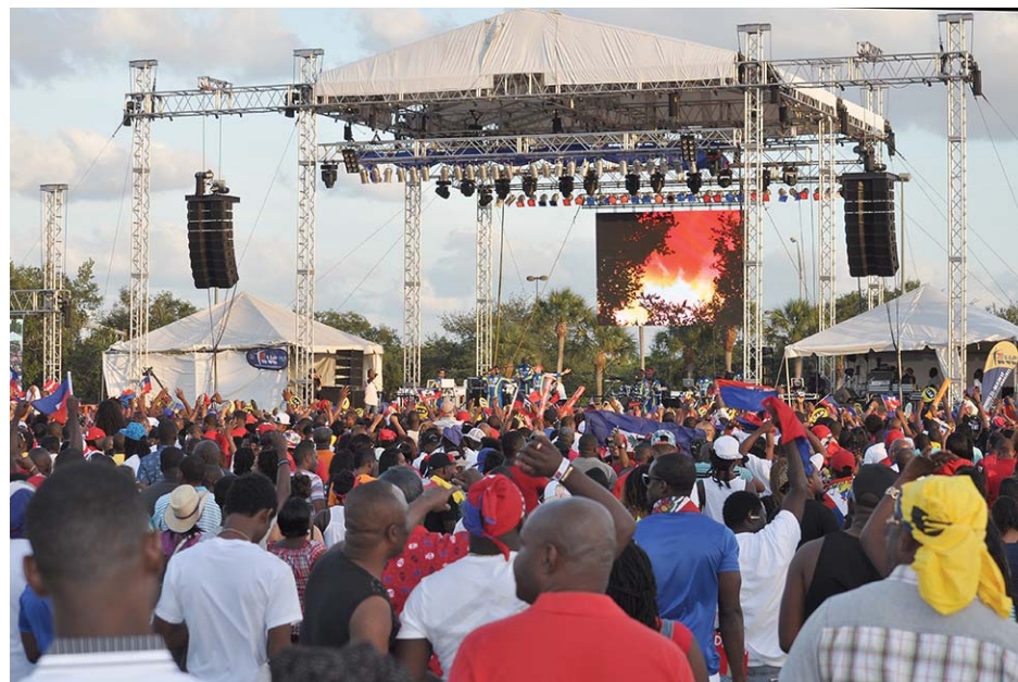
Vue de la grande scène de la seizième édition de "Haitian Compas Festival" déroulée le samedi 17 mai 2014 à Sun Life Stadium, Miami Gardens.

L'événement a bénéficié d'une météo exceptionnelle. Grand soleil, température agréable et petit vent frais pour ce rendez-vous incontournable à Miami-Dade, voire même en Floride, pour tous les amoureux des musiques actuelles, plus particulièrement le compas direct. ( Suite Page 13 )