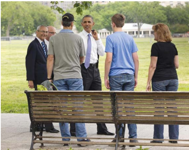
Obama greets National Mall visitors on his walk Wednesday.

The young man then inexplicably began ticking off the things that make America great: "America! Freedom! Peace! Hope! And charity! Woo!"