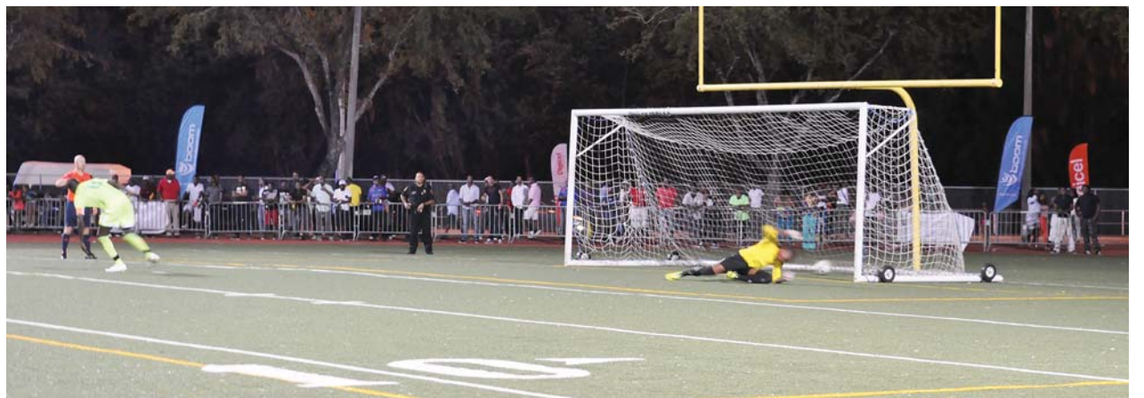
Le huitième tir de pénalty victorieux de l'équipe de Saint-Marc qui l'a permis de remporter le trophée de "Haiti Madame Gougousse Cup" pour la troisième fois.

blanc de Billy Salvador, affichant une défense rigide, presque infranchissable. Et malgré une grosse pression dans la surface violettiste en fin de match, les saint-marcois ne réussirent pas à trouver la faille face à la détermination des violettistes qui avaient remporté ce trophée deux fois dans le passé, 2002 et 2007.