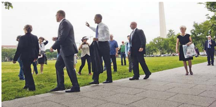
President Obama is surrounded by members of the Secret Service during walking on the National Mall Wednesday.

"What's going on guys?" the president replied