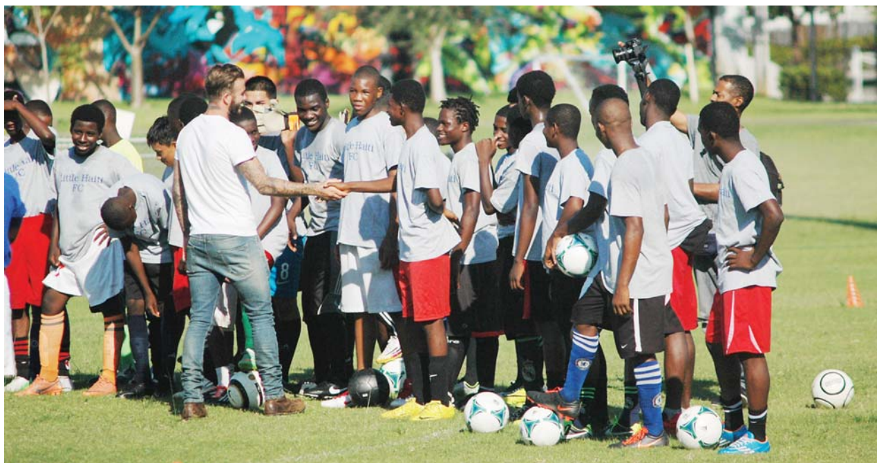
L'ancien capitaine de la sélection anglaise, David Beckham, a serré la main, l'un après l'autre, de tous les membres de "Little Haiti Football Club" avant de poser avec eux pour une photo-souvenir.

"Je suis très heureux d'être ici. Je suis déjà venu dans la communauté haïtienne et on m'a toujours accueilli les bras ouverts, avec beaucoup d'amour.