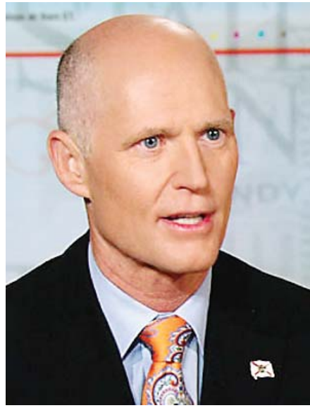
Florida Gov. Rick Scott

"I think it's incumbent for a governor to have their assets in a blind trust," Scott said in a telephone interview. "By not knowing what assets, and hav-