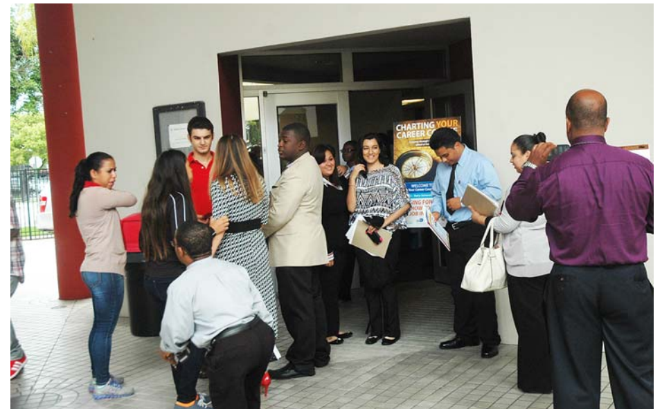
Participants have learned about the things that they should focus on as they branch out and determine the course of their life.