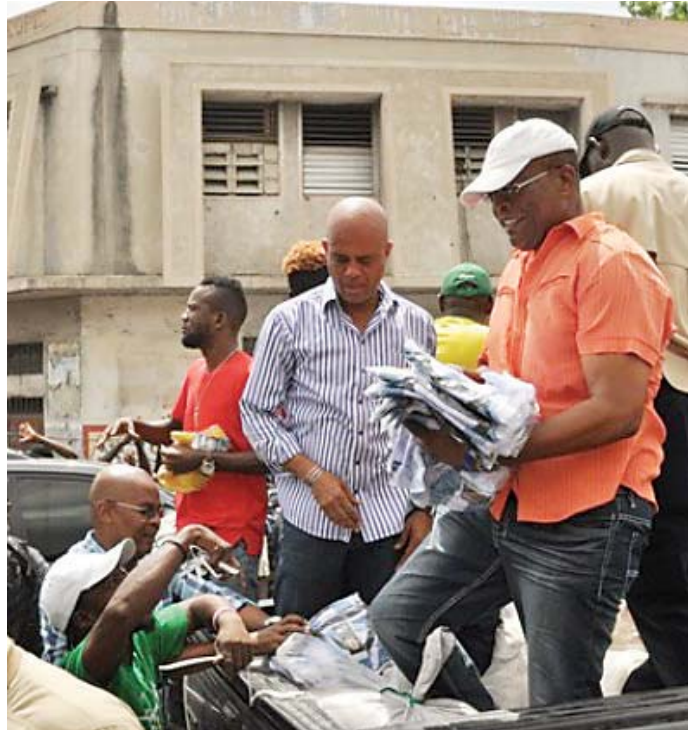
Un président (Michel Martelly) qui distribue des maillots d'autres nations à ses compatriotes à l'occasion de la 20 è édition de la Coupe du Monde de Football.

MIAMI, 12 juin - Deux photos n'ont pas manqué d'alimenter ces derniers jours les conversations entre internautes haïtiens sur les réseaux sociaux. Il s'agit d'un cliché montrant