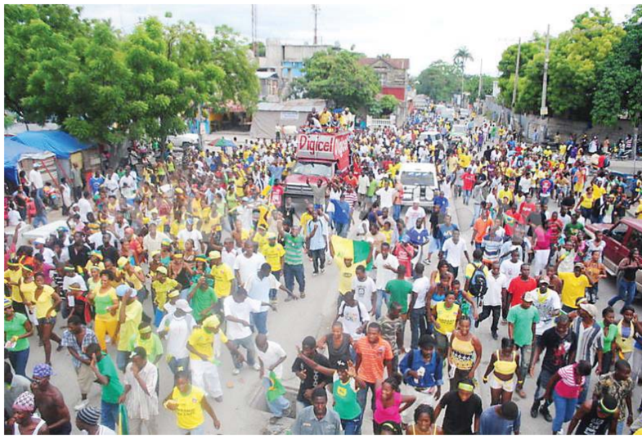
Au lendemain de la dernière manifestation, les mêmes, jeunes, chômeurs, laissés pour compte étaient dans les rues pour fêter la victoire du Brésil sur la Croatie.

Alors, d'un côté on range dans un coin les revendications et récriminations antigouvernementales. Aucune