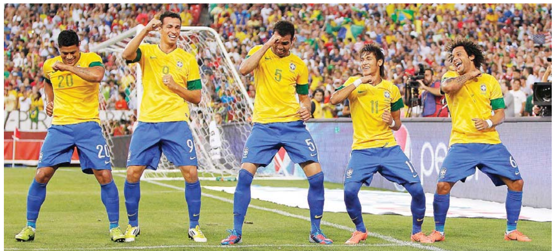
La Seleçao bénéficie d'un soutien populaire extraordinaire lors de ce Mondial. Mais les troupes de Luiz Felipe Scolari devront apprendre à se libérer de cette pression qu'ils jugent positives mais qui pèse malgré tout sur leurs épaules.

Les supporters connaissent la méthode Scolari et ne s'attendent guère à retrouver le joga bonito des années fastes de leur sélection, mais un grain de fantaisie ne ferait pas de mal à une équipe trop studieuse tactiquement et dont l'hyper-discipline pèse sur la créativité. Pour preuve, le sélectionneur brésilien a choisi de pallier le forfait de Hulk en titularisant Ramires, un choix plutôt frileux quand on sait que les feux follets Bernard et Willian sont disponibles et sortent d'une belle saison en club. À un moment ou à un autre, le Brésil devra peut-être lâcher les chevaux et bénéficier de cette explosivité pour l'instant inexistante