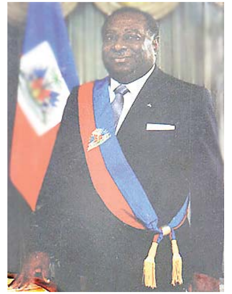
L'ex-Président Manigat, le jour de sa prestation de serment le 7 février 1988.

Un intellectuel exemplaire, intrinsèque sur les principes, il dirigea Haïti du 7 février au 19 juin 1988, avant d'être renversé par le lieutenant-général Henry Namphy (faut-il noter que Namphy était - très vraisemblablement - poussé d'agir sous la pression de Washington). À la présidentielle du 16 décembre 1990, le conseil électoral provisoire de l'époque rejette la candidature de Leslie Manigat sur la base qu'il a été président en 1988. En février 2006, après son échec à la présidentielle, gagnée dans des conditions parti-