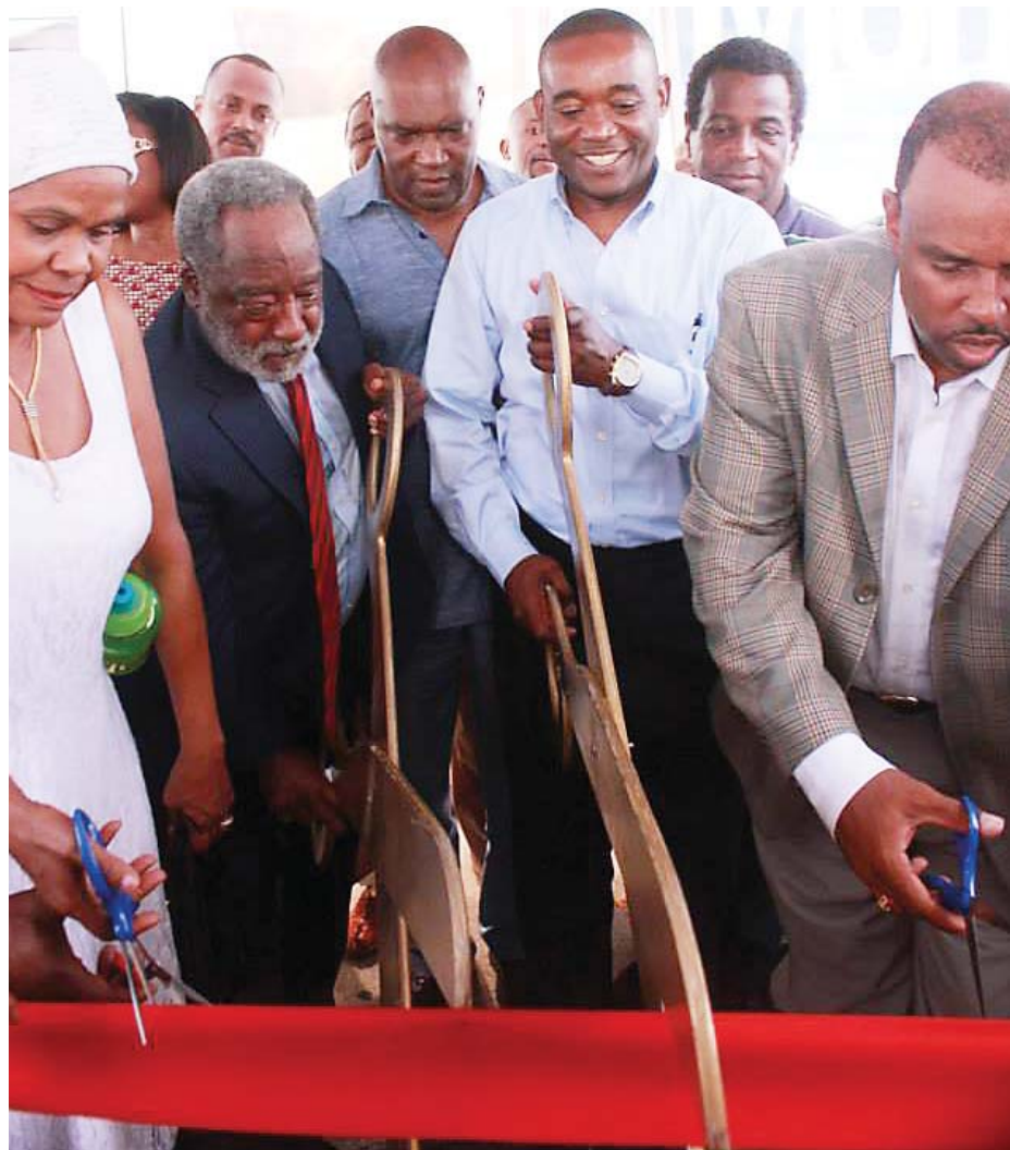
Hundreds (included many well-known personalities in the Haitian-American and African-American communities) attended Open House and Ribbon Cutting Ceremony for Commissioner Jean Monestime Re-Election Campaign 2014. This new location in North Miami will serve as a central location where Monestime's supporters can find vital information.

Today, Monestime is a little more secured financially for his re-election campaign. According to politicalcorradito.com, Monestime's monthly take was the biggest of all the incumbent commissioners up for re-election. He raised a whopping $77,000 in contributions for the election this year just in the month of March 2014 - more than he has in any other single month since he started raising funds in March of last year - bringing his total to nearly $300,000 (up to March 2014) for his re-election bid. Until March 2014, his opponent Rolle has raised a paltry $17,000 in comparison - and only $250 from two donors in the last month.