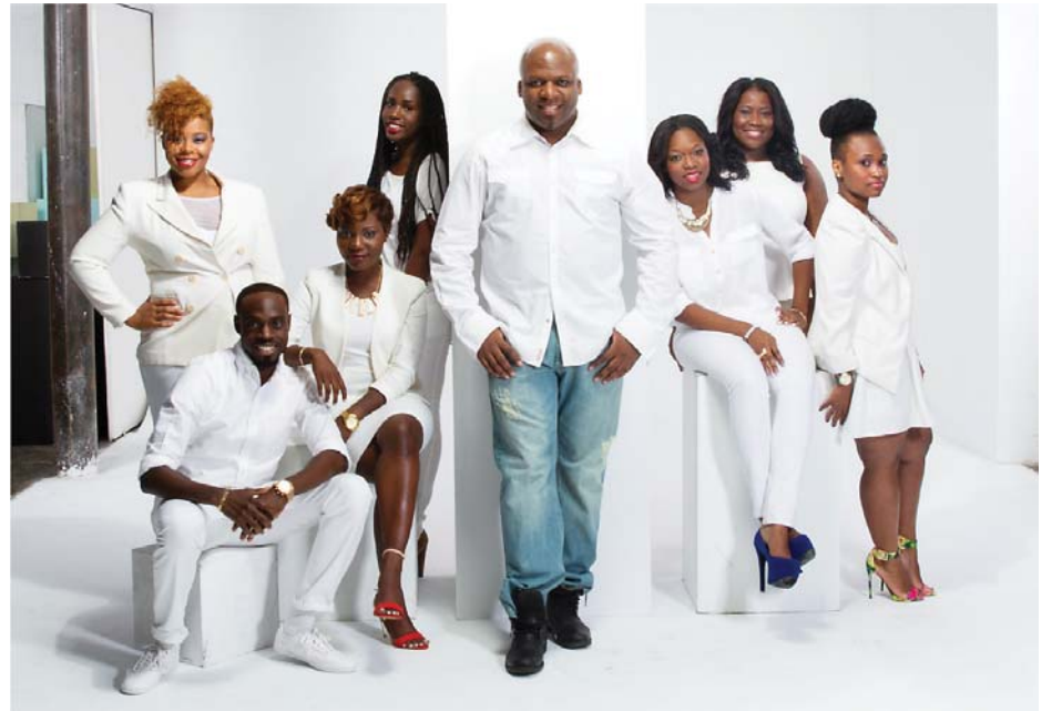
The group Libere