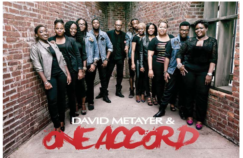
Haitian gospel group OneAccord will also perform at the event in North Miami, Florida.