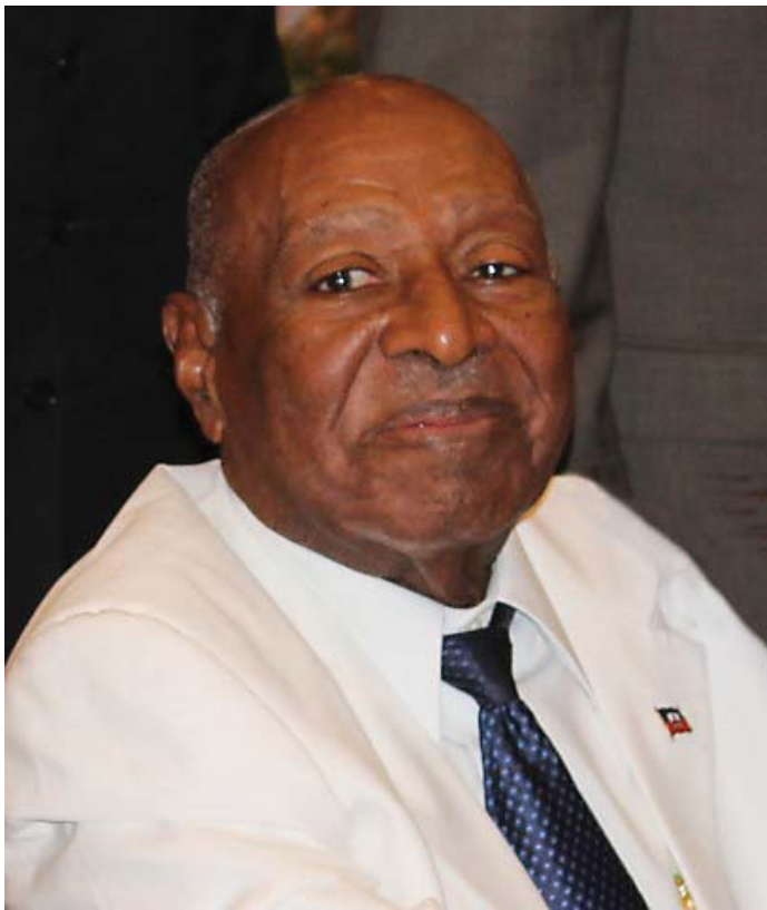
L'ex-Président d'Haïti Saint Roc Leslie François Manigat s'est éteint à l'aube du vendredi 27 juin 2014 à l'âge de 83 ans.

Considéré comme l'un des plus brillants intellectuels qu'Haïti ait produit, Saint Roc Leslie François Manigat, ancien président (7 février 1988 - 20 juin 1988) s'est éteint à l'aube du ven-