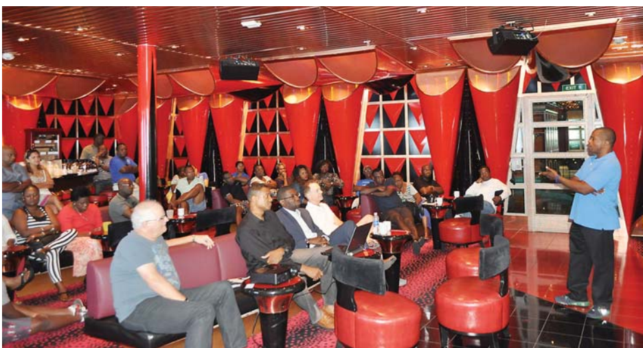
Partial view of the CHS 8th Annual Leadership Cruise Conference participants (second day).

Since 1988, the Center for Haitian Studies has been pivotal in provid-