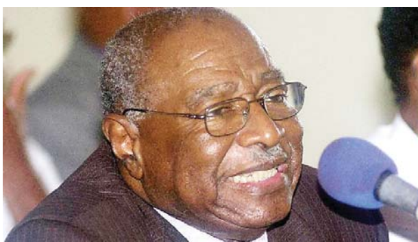
L'ex-Président d'Haïti Saint Roc Leslie François Manigat s'est éteint à l'aube du vendredi 27 juin 2014 à l'âge de 83 ans.

Le professeur a finalement accepté d'y participer, mais il est formel : pas question de répondre aux questions des auditeurs. Le rendez-vous est fixé dans deux semaines avec l'ancien président, le temps pour nous de faire un peu de promotion pour cette interview tant attendue, question aussi de maximiser davantage ce jour là notre taux d'écoute déjà très fort pour une émission nocturne. Mes amis et proches collaborateurs me préviennent de faire