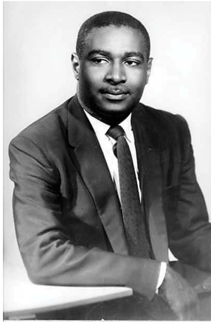
Leslie Manigat dans son jeune âge.