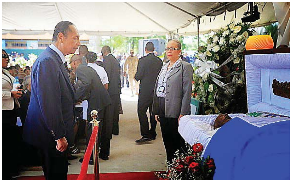
De nombreuses personnalités politiques, dont l'ancien président Jean Claude Duvalier ont assisté aux funérailles de l'ancien président haïtien Leslie Manigat.