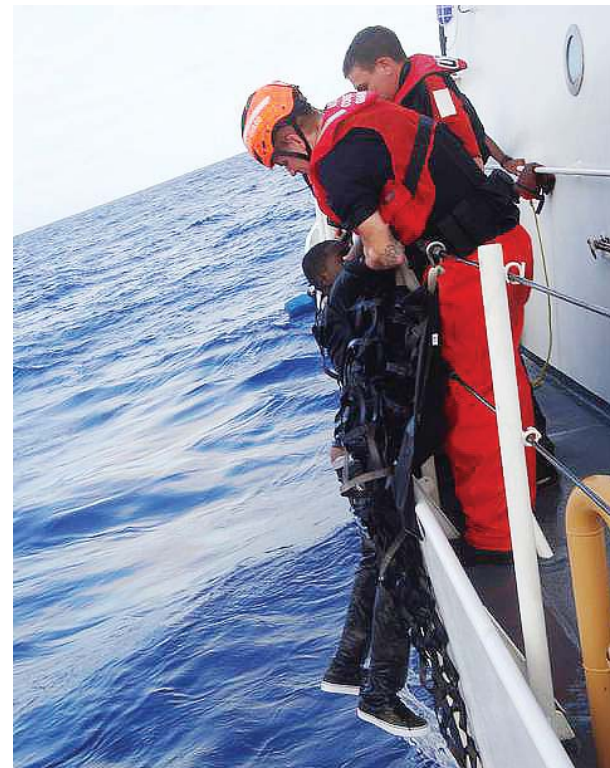
Haiti Migrant rescue: Photo USCG

Upon the cutter Key Largo's arrival on scene, the smugglers, in an attempt to flee the area and avoid interdiction, allegedly threatened the migrants onboard and forced two Haitians, including a minor, overboard without life jackets. The crew of the Key Largo saved the two Haitians and continued to pursue the suspect vessel.