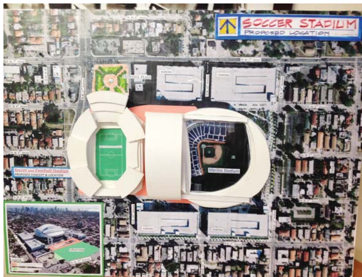
Proposal site for a soccer stadium

Now, Miami-Dade Commissioner “Mayor Sir” Xavier Suarez has gone as far as producing an artist’s rendition for a soccer stadium next to Marlins Park.