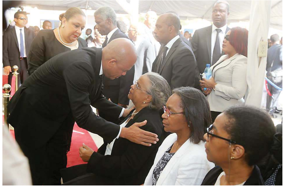
Salutations et présentation de condoléances du Couple présidentiel à la famille Manigat.

Parallèlement, l'on retiendra aussi de Leslie Manigat, un politicien qui aurait probablement été pardonné par la postérité s'il avait reconnu (même une fois dans ses déclarations) son tort d'avoir accepté la présidence des mains des bourreaux militaires en janvier 1988, sans aucun respect pour les malheureux électeurs assassinés lors du carnage du 29 novembre 1987 au bureau de vote de la ruelle Vaillant (Ecole Argentine Bellegarde). Manigat refusa de critiquer ouvertement le CNG, et laissa même entendre que le CEP avait sa part de responsabilité dans le fiasco du 29 novembre 1987.