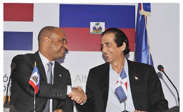
Above : Haiti Prime Minister Laurent Lamothe (left) and Dominican Republic Minister of the Presidency Gustavo Montalvo.

The Dominican government has created a plan to issue work permits and residency documents to migrants who came to the country before October 2011. It has yet to announce a plan to deal with a separate group of people, the descendants of non-citizens who were deemed ineligible for citizenship in a retroactive ruling by the Dominican Supreme Court.