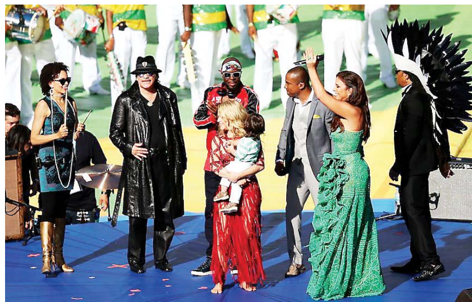
Le natif de la Croix-des-Bouquets Wyclef Jean était parmi les stars invitées par la FIFA à animer la cérémonie de clôture de la vingtième édition de la coupe du monde de football le dimanche 13 juillet 2014 au stade Maracana à Rio de Janeiro.

Pour cette vingtième édition de la coupe du monde de football, si le nom de ce pays de la Caraïbe - absent de cette grande messe depuis quatre