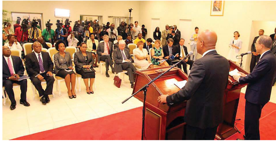
"As far as the cholera disease is concerned, our struggle was always to get the UN to engage, with the Haitian government, in efforts to eradicate cholera," said Martelly.

It is widely believed that the disease was brought to the country by a UN Nepalese military contingent that had