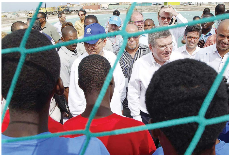
Secretary-General Ban Ki-moon (blue cap) chats with young Haitians at the opening of the Sports for Hope Centre.

With effective intervention from the UN Stabilization Mission in the country (MINUSTAH), the Haitian National Police “were able to restore