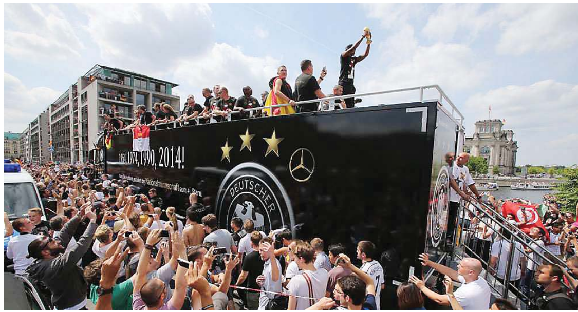
De retour à Berlin, les tout nouveaux champions du monde de foot allemands fendent la foule, en direction de la Porte de Brandebourg.

Higuain est même parvenu quelques minutes plus tard à marquer un but... refusé à juste titre par l'arbitre de la