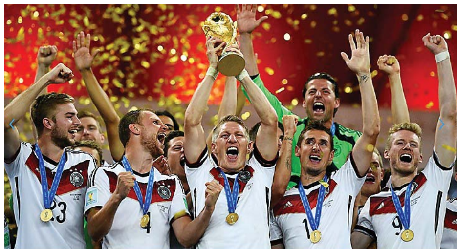
Les Allemands célèbrent leur quatrième coupe du monde de football

Déjà couronnée en 1954, 1974 et 1990, la Nationalmannschaft revient désormais à la hauteur de l'Italie, également quadruple championne du monde. Attaque la plus prolifique du tournoi avec 18 buts - dont 7 en demies contre le Brésil -, l'Allemagne aura donc su prendre le meilleur sur une coriace équipe d'Argentine qui n'avait jusque-là encaissé que 3 buts.