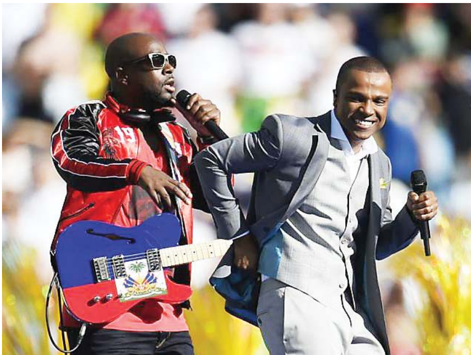
Wyclef Jean (gauche) et le chanteur de samba brésilien Alexandre Pires ont interprété la chanson "We Will Find A Way", un des hymnes officiels de la coupe du Monde Brésil 2014.

RIO DE JANEIRO (Le Floridien) -- La vingtième édition de la coupe du monde de football vient de s'achever sur la victoire (1-0) de l'Allemagne en finale aux dépens de l'Argentine le dimanche 13 juillet, le plaçant désormais à égalité avec l'Italie avec quatre Coupes du monde dans sa vitrine.