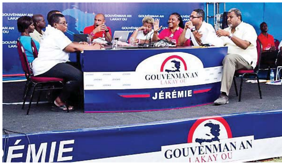
Photo prise lors de la 6 e édition de "Gouvènmàn an lakay ou", tenue à Jérémie, le samedi 22 mars 2014.

La neuvième édition sera une grande première dans la mesure que c'est pour la première fois que l'équipe gouvernementale a décidé de venir à la rencontre des fils du pays vivant à l'étranger, dont leur apport économique au pays natal est très significatif. Ce sera l'occasion pour les membres de la diaspora haïtienne basée en Floride du sud d'exprimer leurs pensées en toute liberté (nous l'espérons bien) face à ces personnalités qui ont le destin de la nation entre leurs mains sur des