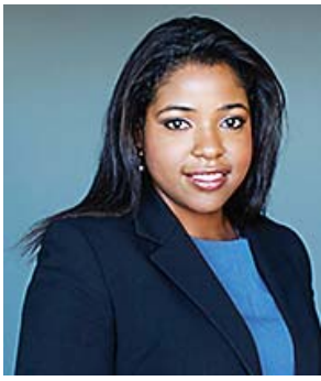
By Patricia Elizee, Esq

When an immigrant obtains their green card through marriage to a Lawful Permanent Resident or a US Citizen, they will be issued a Conditional Residence unless the marriage was for more than 2 years. A joint petition to remove the conditions must be filed within 90 days of the 2nd anniversary of the Conditional Residence. This is done by filing Form I-751 with USCIS. Once the application is approved the immigrant will receive their Lawful Permanent Residence status.