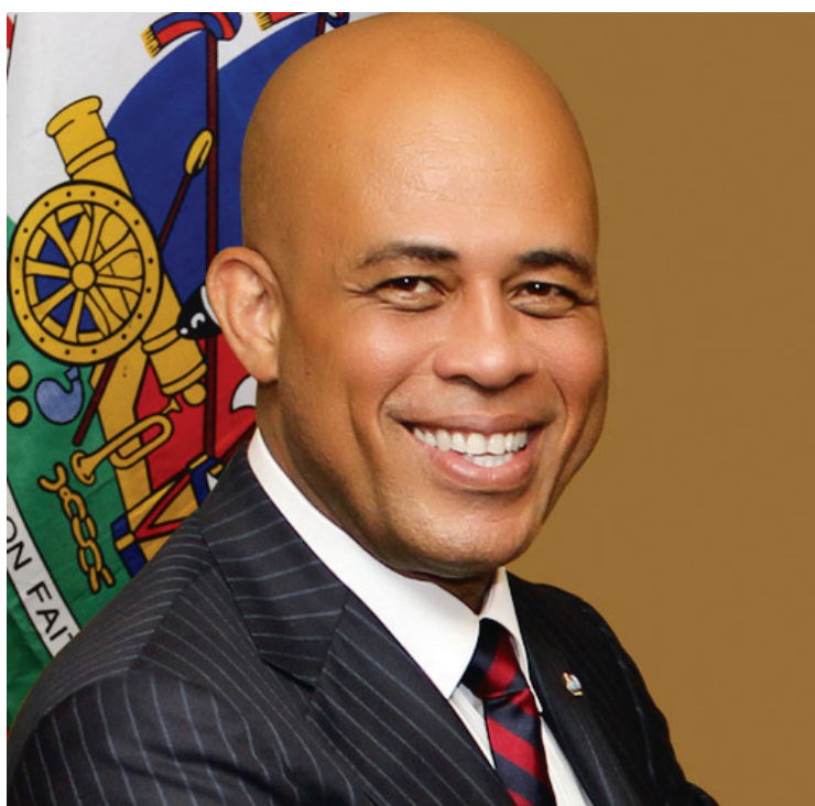
À l'évidence, il y a peu d'espoir pour une passation de pouvoir entre le président Michel Martelly (photo) et son successeur démocratiquement élu à la date du 7 février 2016

MIAMI -- La Constitution haïtienne de 1987 amendée prévoit l'élection du président de la République le dernier dimanche du mois d'octobre de la 5ème année du mandat en cours. L'article 134.2 stipule que " le président élu entre en fonction le 7 février suivant la date de son élection. Au cas où le scrutin ne peut avoir lieu avant le 7 février, le président élu entre en fonction immédiatement après la validation du scrutin et son mandat est censé avoir commencé le 7 février de l'année de l'élection ".