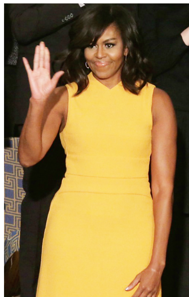
Here's the first lady Michelle Obama looking fabulous in her Narciso Rodriguez highly-debated dress at her husband's last State of the Union on January 12, 2016.