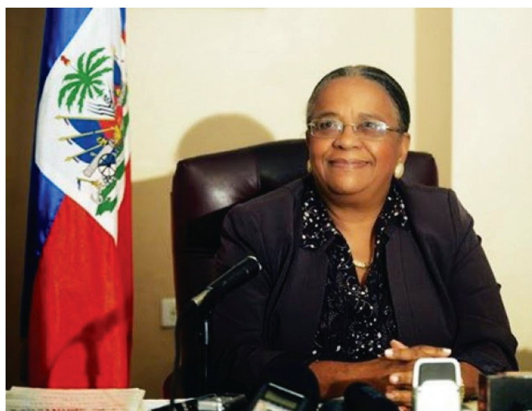
« Je suis disponible et disposée à présider la transition si on me le demande », a déclaré récemment dans la presse l'ex-sénatrice de la république et actuelle secrétaire générale du parti RDNP

Candidate malheureuse à l'élection présidentielle de 2010, Mirlande Manigat, qui s'est mise en réserve de la République, sort de son silence. Après le MOPOD, on la retrouve maintenant dans le camp de ceux qui exigent l'annulation des élections du 9 août, le départ du pouvoir en place et la formation d'un gouvernement de transition avec pour mission principale l'organisation d'élections générales. La secrétaire générale du RDNP se dit prête à prendre les rênes de ce gouvernement.