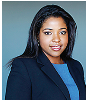
By Patricia Elizée, Esq.

There is no magic eight ball for what our future holds for us. We fall in love, we get married and some-