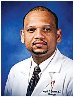
By Dr. Angelo E. Gousse

Urinary incontinence, or the involuntary leakage of urine is one of the most common problems treated in female urology. It is important for the clinician to realize that there are several different types of urinary incontinence, each with a different cause and potential treatment options. These include stress incontinence (not related to psychologic stress), urge incontinence, overflow incontinence (bladder too full), mixed incontinence (simultaneous stress and urge incontinence), total incontinence and functional incontinence.